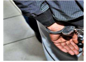
(Billet 396) – Décapitez-le à l'hâte !