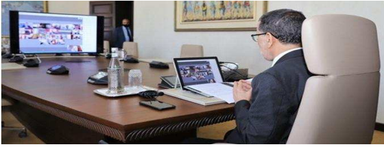
(Billet 398) – Le pouvoir exécutif n'exécute plus rien, ou presque...