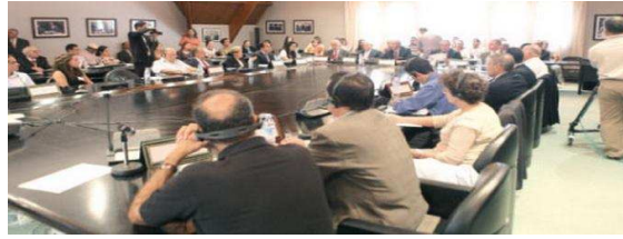
(Billet 397) – Ces débats qu'il reste (sérieusement) à ouvrir...